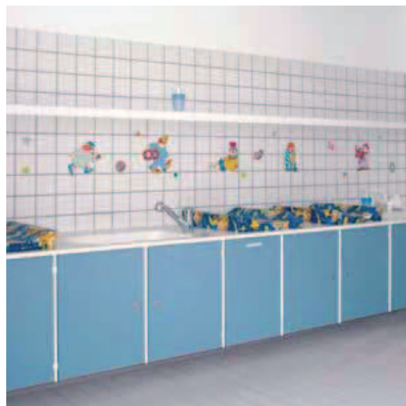
Roskildebadet, Roskilde, Dänemark Unterschranke aus dem Geschwender Schranksystem mit Abdeckplatte aus Mineralwerkstoff.