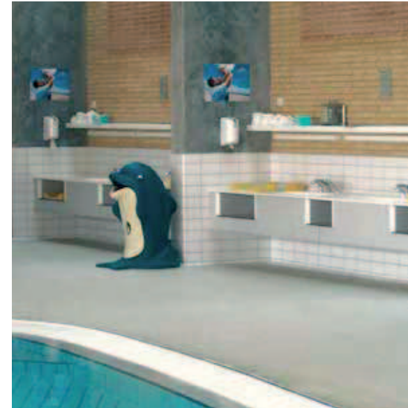
Svømmehal, Farum, Dänemark Wickelplätze im Bereich des Kinderbeckens.